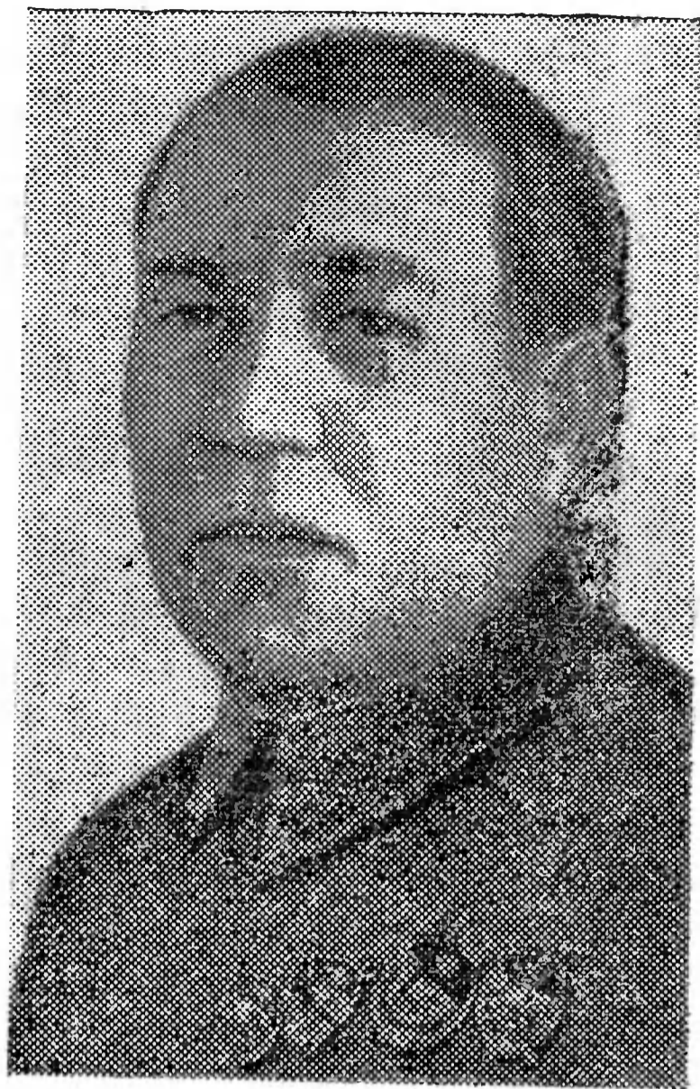
Е. Г. Евдокимов

В начале 1928 года органами ОГПУ была раскрыта и предана суду крупная вредительская организация буржуазных специалистов в Шахтинско-Донецком округе Северо-Кавказского края. О результатах расследования «шахтинского дела» полномочный представитель ОГПУ Е. Г. Евдокимов доложил на II пленуме Северо-Кавказского крайкома ВКП(б) в конце марта 1928 года.