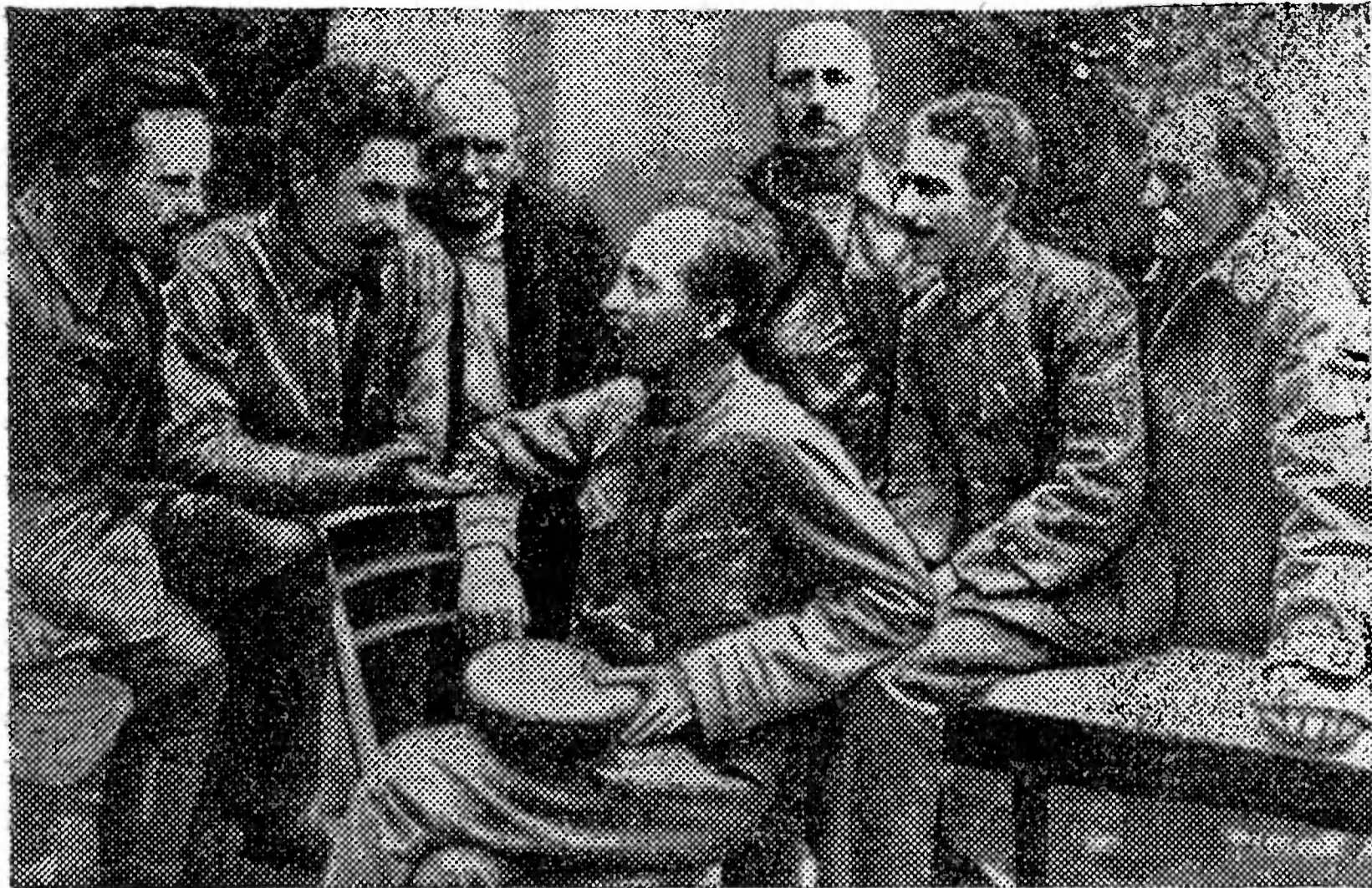
Ф. Э. Дзержинский среди своих соратников. Крайний справа — В. И. Савинов

большой урон народному хозяйству. Чекистам пришлось и на этом участке быстро и решительно помогать советским органам наводить порядок. Были дни, когда многое зависело от нескольких эшелонов продовольствия, топлива, от бесперебойной работы электростанции и даже больницы. В. И. Савинов лично уделял огромное внимание этим вопросам.