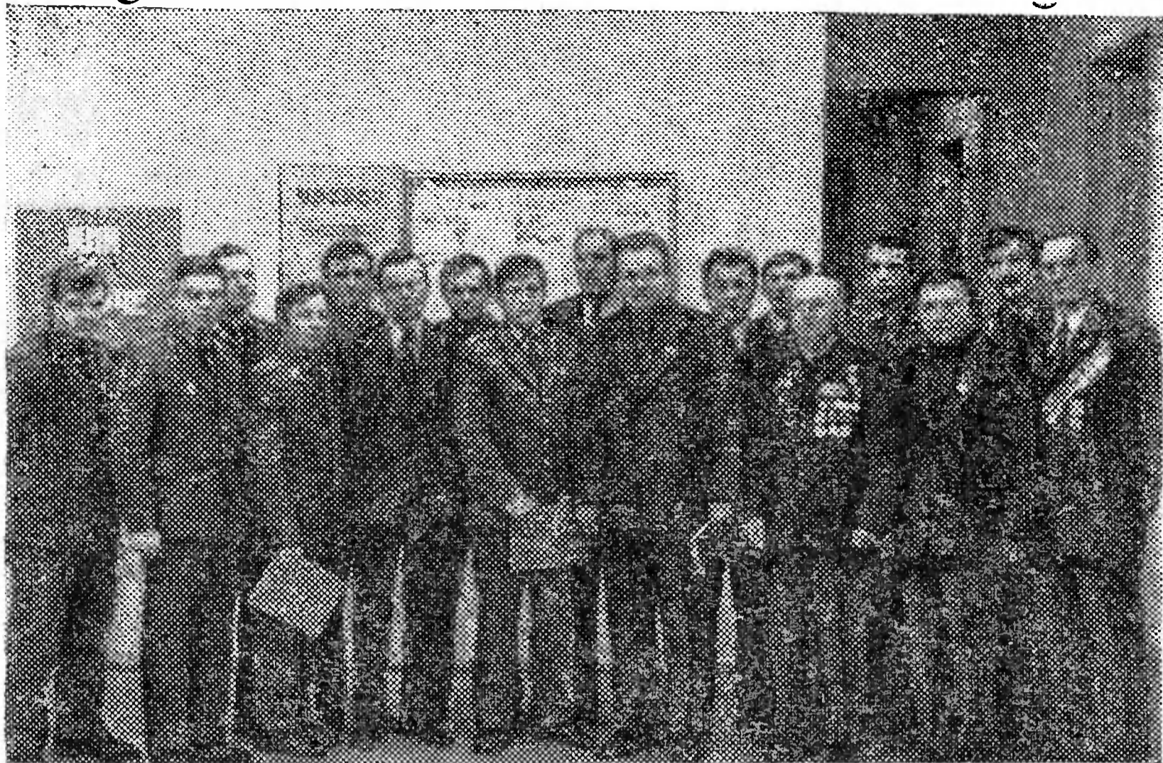
Встреча молодых чекистов с руководством и ветеранами Управления КГБ.